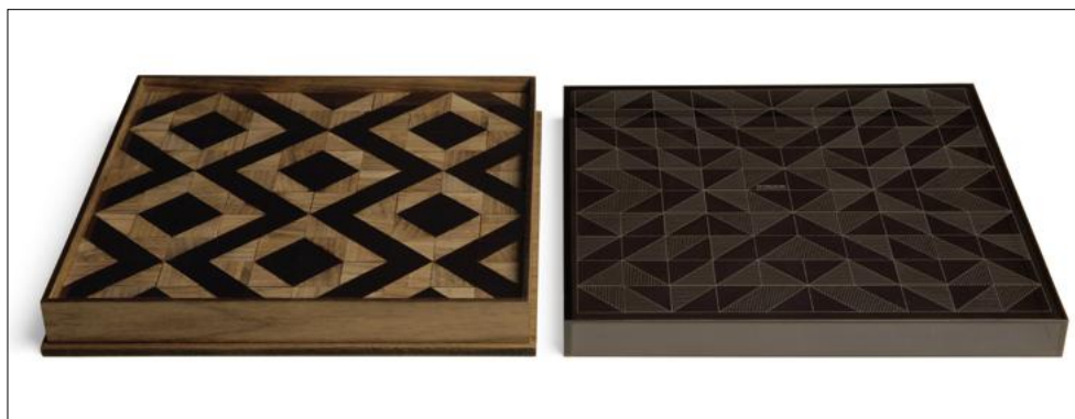
Table puzzle composed of tiles in fumé methacrylate and canaletto walnut. The set is contained in a solid canaletto walnut and fumé methacrylate box. DIY has the dual function of a game and a highly decorative piece of furniture. The tiles can be used to create infinite geometric decorations.

DIY svolge la duplice funzione di gioco e arredo dalla forte carica decorativa. Attraverso le tessere è possibile creare infinite decorazioni geometriche.